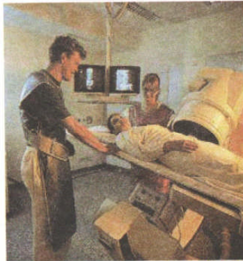
زیر نظر رییس بخش قلب :

در صورت مراجعه به پزشک و دندانپزشک حتماً یادآوری کنید که استنت دارید و قرص ضد انعقاد مصرف می کنید.